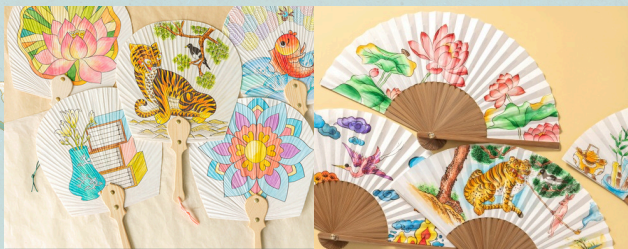
단오선 ( 단선 / 접선 )